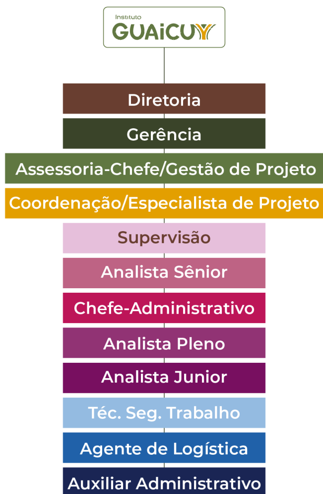
Figura 3 - Legenda da hierarquia do novo organograma, por cores e disposição vertical