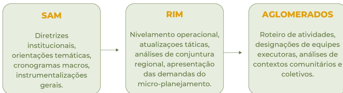
Figura 4 – Fluxo de diretrizes institucionais